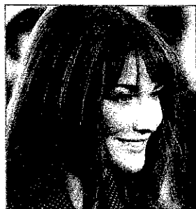
Carla Bruni.

Au terme de cette étude et malgré des données nécessairement imparfaites, il apparaît que les genres de la chanson française qui